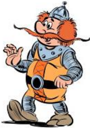
Rysunek 3. Na podstawie grafiki Łukasza Ciaciucha

Nazwijcie bohatera lektury i wpiszcie odpowiednie cechy charakterystyczne dla tej postaci spośród wymienionych niżej.