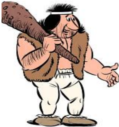
Rysunek 5. Na podstawie grafiki Łukasza Ciaciucha

Nazwijcie bohatera lektury i wpiszcie odpowiednie cechy charakterystyczne dla tej postaci spośród wymienionych niżej.