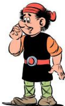
Rysunek 1. na podstawie grafiki Łukasza Ciaciucha

Nazwijcie bohatera lektury i wpiszcie w tabelę odpowiednie cechy charakterystyczne dla tej postaci spośród wymienionych niżej.