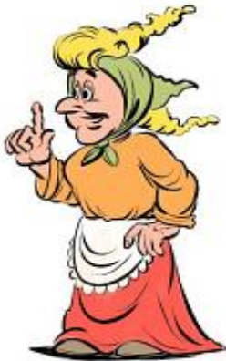
Rysunek 6. Na podstawie grafiki Łukasza Ciaciucha

Nazwijcie bohatera lektury i wpiszcie odpowiednie cechy charakterystyczne dla tej postaci spośród wymienionych niżej.