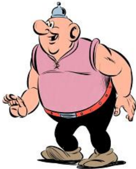
Rysunek 2. Na podstawie grafiki Łukasza Ciaciucha

Wpiszcie odpowiednie cechy charakterystyczne dla tej postaci spośród wymienionych niżej.