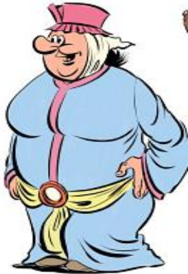
Rysunek 4. Na podstawie grafiki Łukasza Ciaciucha

Nazwijcie bohatera lektury i wpiszcie odpowiednie cechy charakterystyczne dla tej postaci spośród wymienionych niżej.