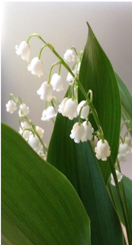
Rysunek 1. Konwalia.