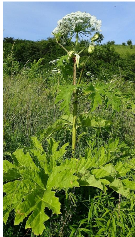
Rysunek 2. Barszcz Sosnowskiego.